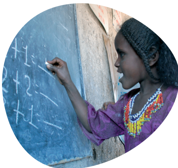
1 Stand: Februar 2012

Islamic Relief bietet Ihnen zwei verschiedene Möglichkeiten, Waisenkindern zu helfen: durch eine 1:1-Patenschaft oder den Waisenfonds.